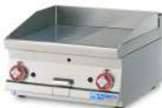
Bratplatten , Ausführungen GAS oder ELEKTRO glatt, geriffelt, hartverchromt oder glatt/geriffelt. In den Arbeitsbreiten 400, 600 und 800mm