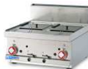
Fritteusen , Ausführung GAS oder ELEKTRO 1 Becken oder 2 Becken, 8 oder 10 Liter. Inkl. Frittierkorb, Fettfilter, Abdeckblech