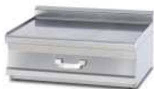
Arbeitsplatten , mit Schublade. In den Arbeitsbreiten 300, 400, 600 und 800mm