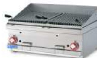
Lavaglühstein-Grill , Arbeitsbreite 400 und 600mm - 1 Rost 380x425mm Arbeitsbreite 800mm - 2 Roste à 380x425mm