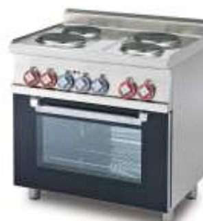
Elektro-Herde , 4 oder 6 runde Kochplatten Elektro-Multifunktions-Backofen oder Elektro-Statistischer-Backofen. In den Arbeitsbreiten 600, 800 und 1000mm.