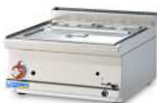
Bainmarie - Wasserbad Ausführung GAS Arbeitsbreite 400 und 600mm Ausführung ELEKTRO Arbeitsbreite 300, 400 und 600mm