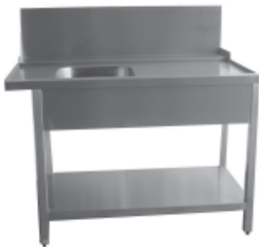
Zu- und Ablauftische