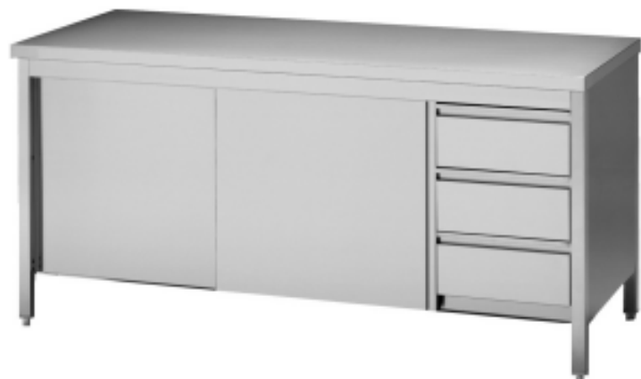
Schranktisch mit Schiebetüren und Schubladenblock wahlweise links oder rechts