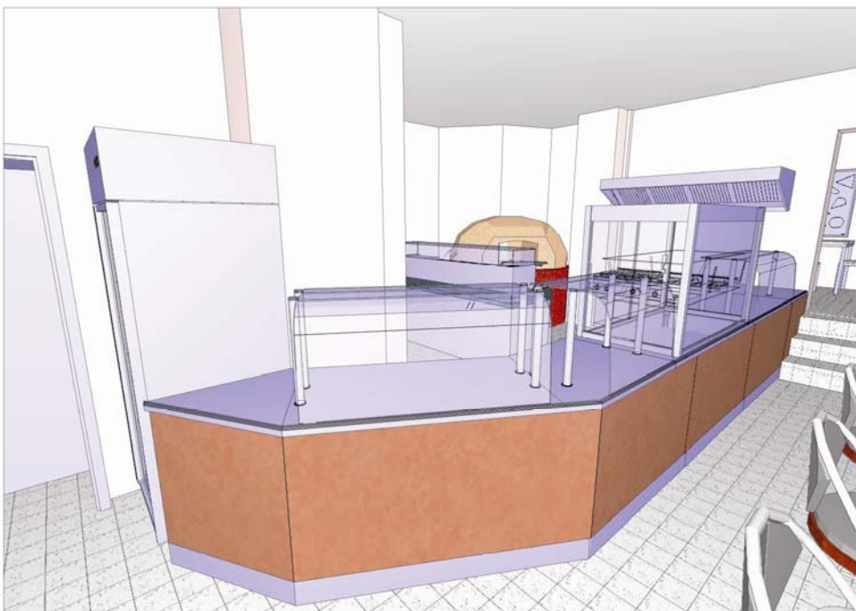
Planungsbeispiel: Bistro, Eckkombination mit Holzdekorverkleidung